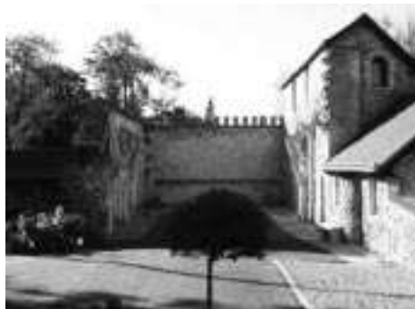
Le prieuré d'Heudreville

Pour le mettre à l'abri de tout revers de fortune, le Conseil Général de La Réunion lui vote aussi une subvention annuelle de 3 600 F.