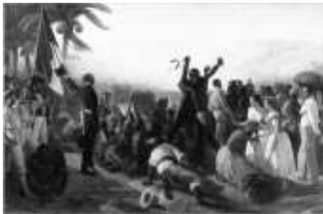
Proclamation de la liberté aux Noirs, peint en 1849 par Auguste-François Biard

Et puis arrive la mise en application du décret, le 20 décembre, avec le discours très attendu de Sarda Garriga