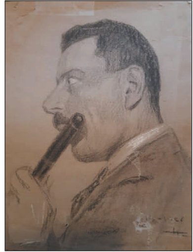
Cette petite flûte, dont il jouait à la perfection, a accompagné Clément Blanc pendant toute sa carrière

22 décembre 1982 : Clément Blanc décède à son domicile parisien. Après un hommage national aux Invalides, sa dépouille est inhumée dans la tombe familiale d'Amélie-Les-Bains.