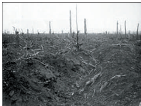
Les obus ont haché menu une forêt

ordonné l'état-major britannique, persuadé que les Allemands, écrasés par les bombardements massifs, sont hors de combat. C'est une erreur fatale car les Allemands, protégés des obus par de solides abris souterrains, ripostent vigoureusement. Les Britanniques subissent des pertes énormes. Le soir, le bilan est catastrophique et s'élève à 19 240 hommes dont plus de 1000 officiers, mis hors de combat en une douzaine d'heures.