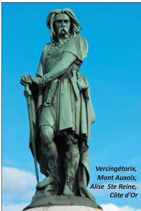
Vercingétorix, Mont Auxois, Alise Ste Reine, Côte d'Or