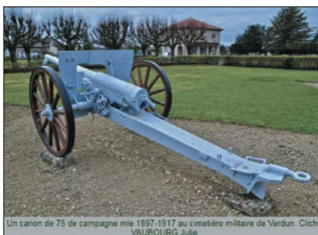
Un canon de 75 de campagne mis 1897-1917 au cimetière militaire de Verdun.