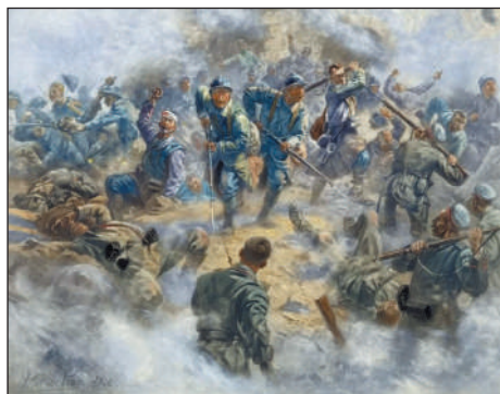
Reprise du fort de Douaumont par les français, le 24 octobre 1916.

Les pertes se sont élevées à 750 000 hommes, 362 000 Français et 337 000 Allemands.