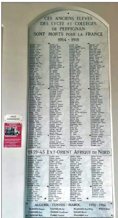
Les anciens d'Arago ont payé un très lourd tribut lors de la guerre de 14-18 comme le rappelle cette plaque apposée dans le hall du lycée.