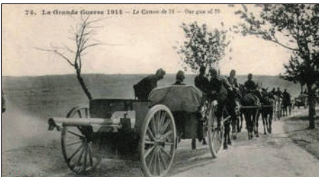
Canon de 75 tracté par un attelage de chevaux