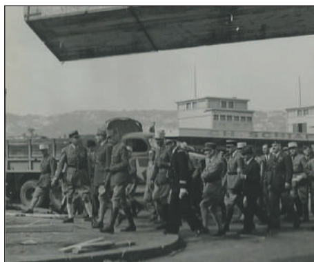
Le débarquement de caisses de matériel américain sur les quais du port d'Alger