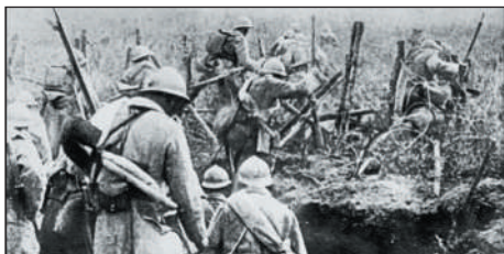
Soldats français passant à l'attaque depuis leur tranchée.

Au début de 1916, alors que les armées se sont enterrées dans des tranchées et ne progressent plus, l'état-major allemand décide d'effectuer une percée décisive en « saignant » l'armée française. Le secteur choisi est celui de Verdun en Lorraine.