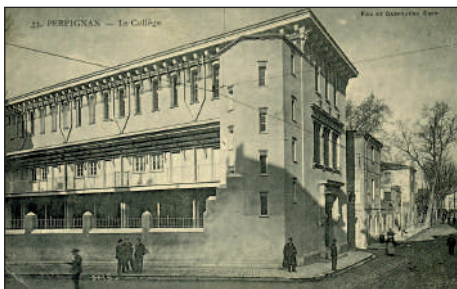
Le collège Arago dont une grande partie a été démolie