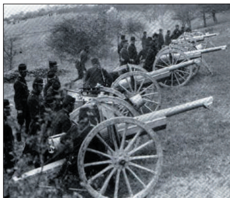
Canons de 75 en batterie

Enfin, ce qui lui conférait sa dignité, c'était chez ses citoyens (et chez ses soldats par conséquent) la notion du devoir; le sens de la responsabilité collective et par-dessus tout, le sentiment de la fierté nationale. »