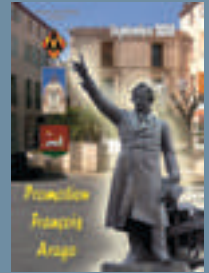
2008 : François ARAGO