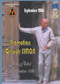
2006 : Claude SIMON