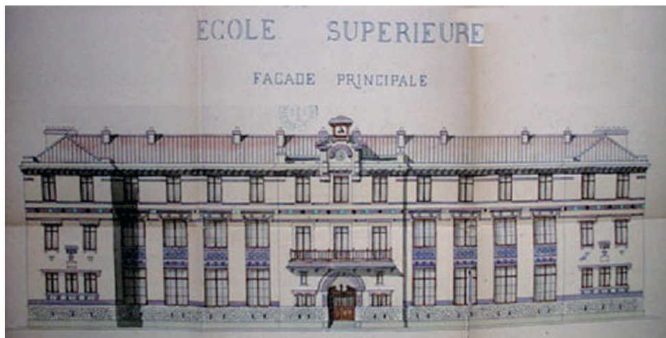
Le bâtiment est l'oeuvre de l'architecte Léon Baille, auteur du belvédère du Rayon Vert à Cerbère et de l'hôpital de Perpignan

çaise, morale (la première année), instruction civique (les deuxième et troisième années), langues vivantes, mathématiques, sciences physiques et naturelles, histoire et géographie, comptabilité, chant, dessin ».