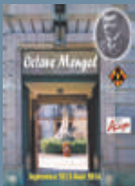
2013 : Octave MENGEL