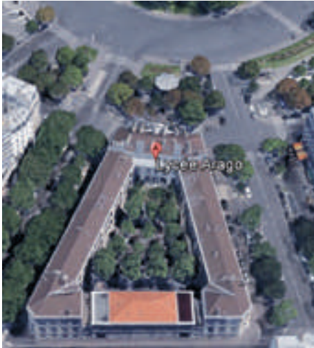
Le bâtiment en forme de A en référence à l'initiale d'Arago

Les écoles primaires supérieures (EPS) furent créées par Guizot en 1833. Il voulait élargir l'enseignement secondaire pour les enfants de famille modeste. Toutes les disciplines du programme des collèges royaux y sont, sauf le grec et le latin qui étaient remplacés par une langue étrangère. Édifié en 1880, le lycée Arago de Paris fut d'abord une EPS modèle.