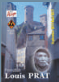
2014 : Louis PRAT