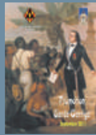
2011 : SARDA GARRIGA