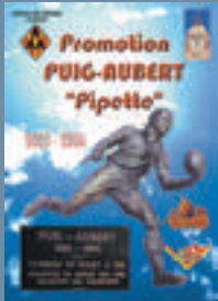
2005 : « Pipette » PUIG-AUBERT