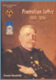
2003 : Joseph JOFFRE